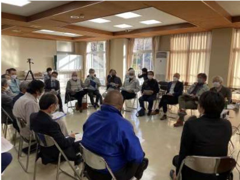
成果報告会（両組合の役職員も出席）

掛川市森林組合さんについて 掛川市森林組合さんは当組合と同じ、大井川と天竜川の間に挟まれた太田川流域の森林組合です。掛川市内を管轄し、原谷川流域の森林を主なフィールドとして事業を展開されています。